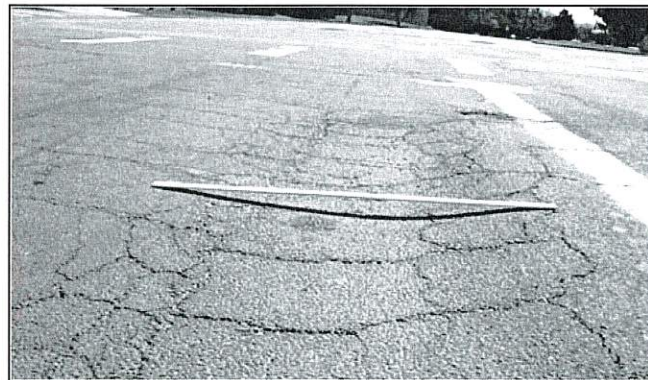
Gambar rajah 2 (b)