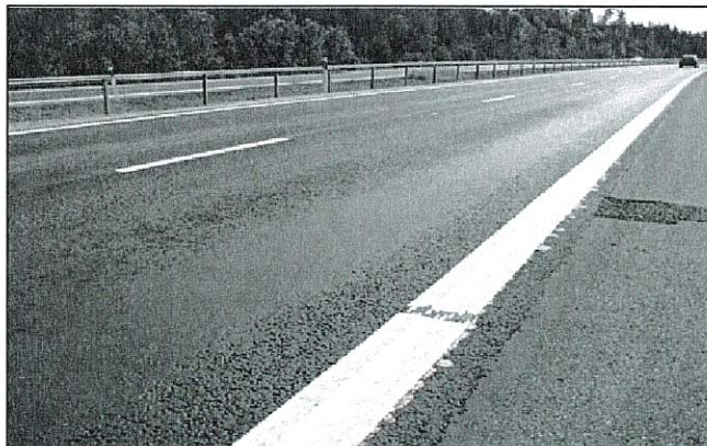
Gambar rajah 2 (c)