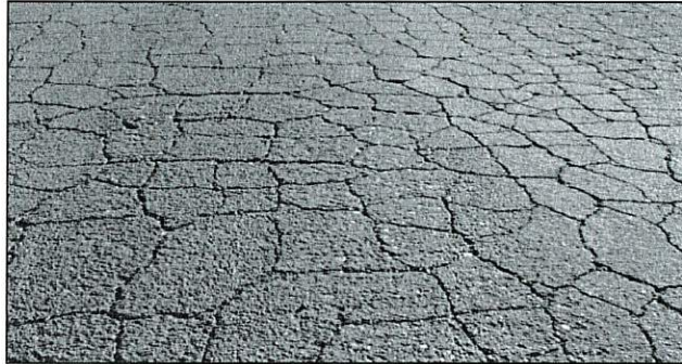
Gambar rajah 2 (a)