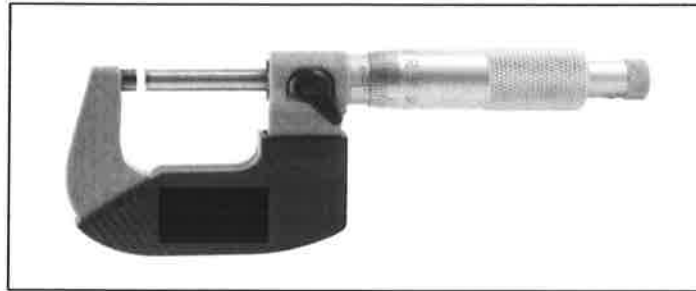
Gambar rajah 9(b)